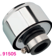
Art. 91505 Ø 58 mm, Höhe 36 mm