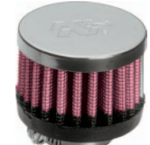
Art. 91557 Ø 51 mm, Höhe 38 mm