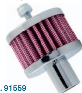
Art. 91559 Ø 51 mm, Höhe 38 mm