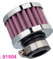
Art. 91504 Ø 51 mm, Höhe 36 mm