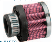
Art. 91556 Ø 35 mm, Höhe 29 mm