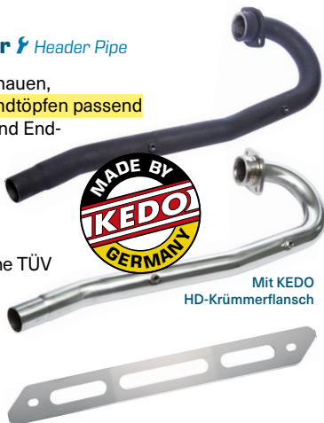
Mit KEDO HD-Krümmerflansch