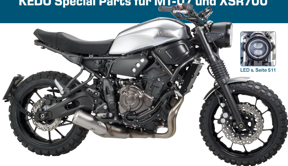
LED s. Seite 511